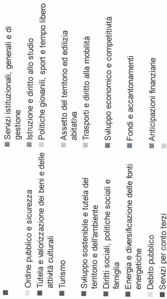
Diagramma 15: Parte capitale per missione